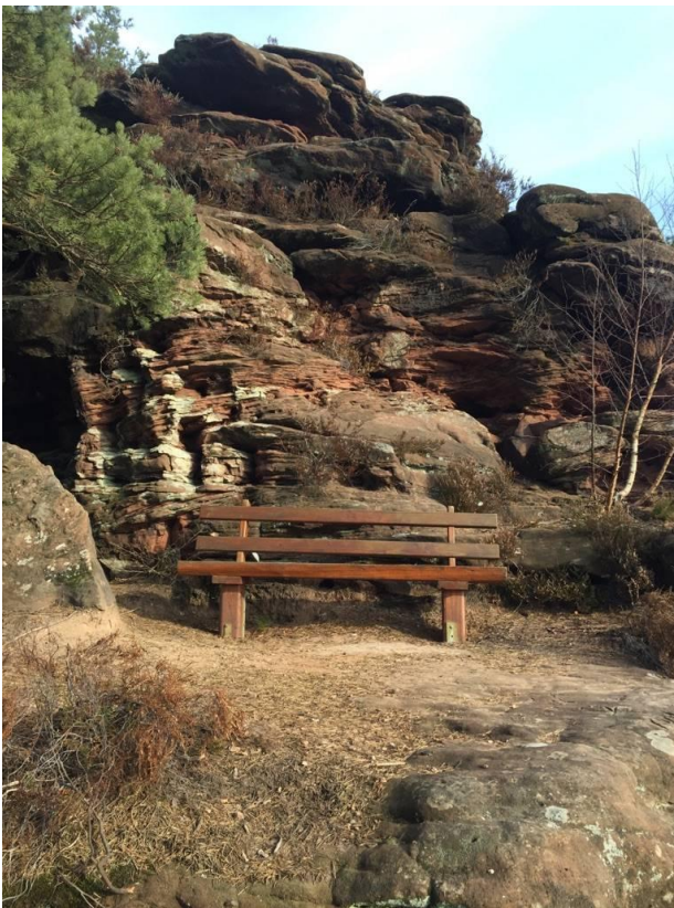
Ruheplatz und Aussichtspunkt am Höllenfels

Diese Wanderung ist besonders für Familien geeignet. Die Kurzstrecke verläuft ausschließlich auf der Sonnenseite des Höllenberges; die Normalstrecke führt zusätzlich über den Kamm. Es gibt wunderbare Ausblicke auf Spirkelbach, Hauenstein und Lug.