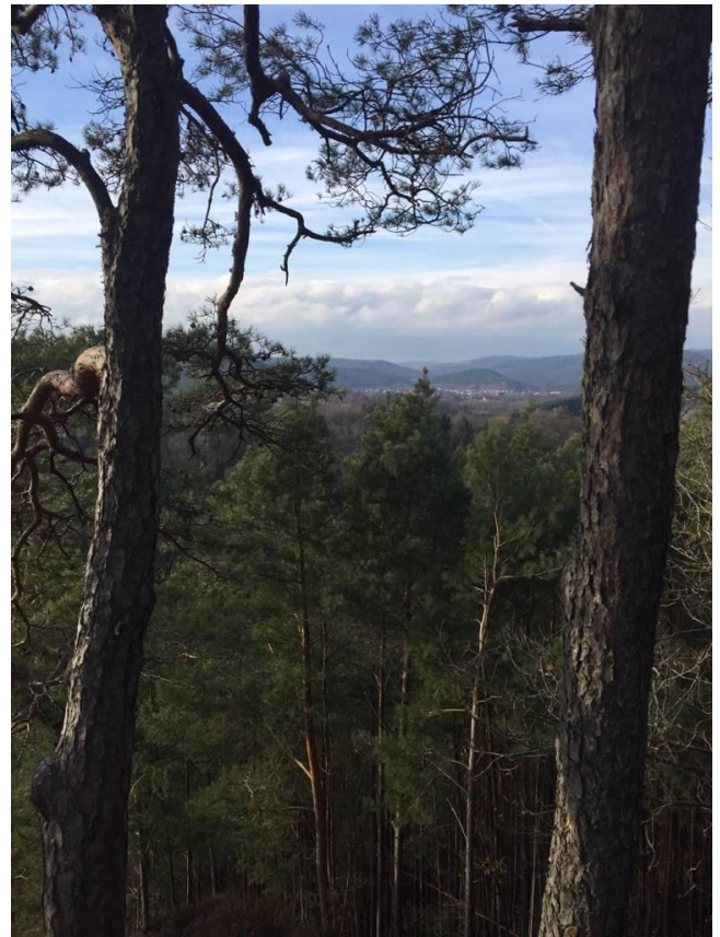
Blick auf Hauenstein